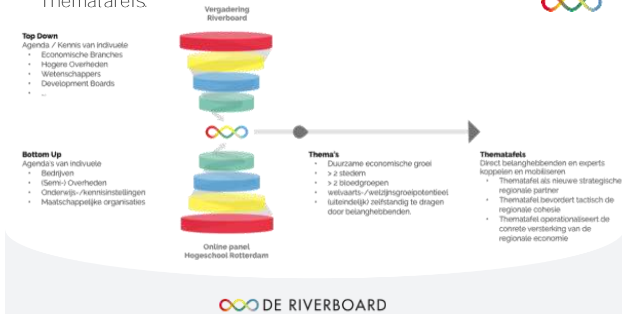
Figuur 1: De werking van de Tafels

Het samenwerken in 1 economisch systeem heeft voor iedereen voordelen. Voor het thema Leven Lang Ontwikkelen noemen we hieronder enkele voorbeelden.