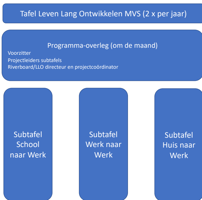
Figuur 3: de organisatie van de Tafel LLO