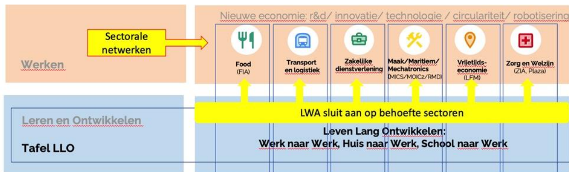
Figuur 2: het leerwerkakkoord sluit aan bij de behoefte van de sectoren

In het leerwerkakkoord (LWA) komen de koepelafspraken te staan tussen de samenwerkingspartners van de Tafel LLO. Op welke wijze wordt een sluitende aanpak geborgd op LLO in onze Waterwegregio? Wie staat waarvoor aan de lat? En per sector wordt een sectorplan toegevoegd. Op welke wijze sluit bv de sector Food aan op 'Gaan voor een baan'? Wie doet wat? De samenwerking van de drie O's: ondernemers (en werkgevers), Onderwijs en Overheid vindt plaats in alle drie de pijlers en krijgt vorm door het sluiten van een overkoepelend Leerwerkakkoord (LWA) voor de MVS regio, waaronder sectorplannen worden afgesloten. In de LWA's worden specifieke afspraken gemaakt over de inzet die door de partners wordt gedaan en de hulp die daarbij nodig is. Afstemming met de bestaande netwerken en organisaties is daarbij cruciaal, zoals bv de afstemming met het UWV.