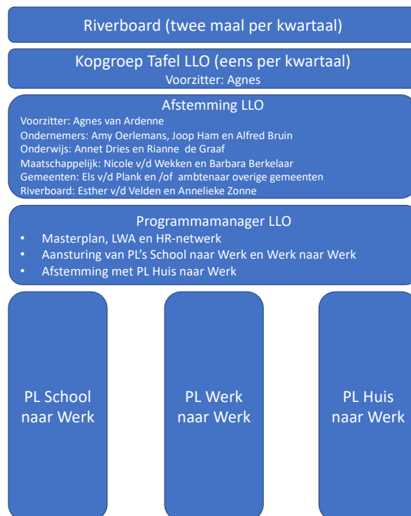
Figuur 4: Organisatie LLO